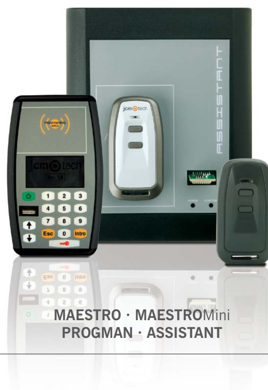
MAESTRO · MAESTROMini PROGMAN · ASSISTANT

jcmtechnologies essere un passo avanti: con tecnologia e immaginazione